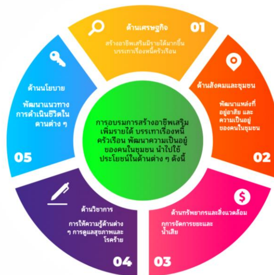
ภาพที่ 2 การนำหลักสูตรที่อบรมไปใช้ประโยชน์

บทความวิจัยนี้ได้สรุปองค์ความรู้ โดยนำเสนอหลักสูตรที่ต้องการอบรมการสร้างอาชีพเสริมมีรายได้มากขึ้น บรรเทาเรื่องหนี้ครัวเรือน พัฒนาความเป็นอยู่ของคนในชุมชน และการนำความรู้ที่ได้จากการอบรมบริการวิชาการไปใช้ประโยชน์ 1) ด้านเศรษฐกิจ สร้างอาชีพเสริมและเกิดรายได้ต่อครัวเรือนมากขึ้น 2) ด้านสังคมและชุมชน พัฒนาแหล่งที่อยู่อาศัย และความเป็นอยู่ของคนในชุมชน 3) ด้านทรัพยากรและสิ่งแวดล้อม จัดการขยะและน้ำเสีย 4) ด้านวิชาการ การให้ความรู้ด้านต่าง ๆ การดูแลสุขภาพและโรคภัย และ 5) ด้านนโยบาย พัฒนาแนวทางการดำเนินชีวิตในด้านต่าง ๆ ดังแผนภาพดังนี้