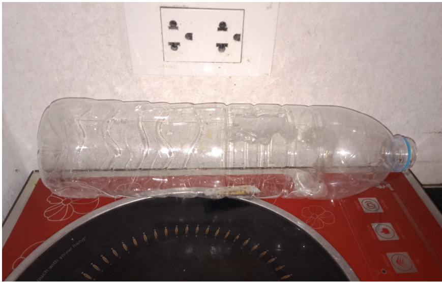
ภาพที่ 2 กับดักแมลงสาบตัวแก่ที่ทำจากขวดน้ำพลาสติก

วิธีการวางกับดักแมลงสาบจากท้องตลาด เพื่อนำมาศึกษาเปรียบเทียบประสิทธิภาพในการดักจับแมลงสาบนำกับดักแต่ละชนิดพร้อมเหยื่อล่อไว้แล้วไปวางไว้บริเวณที่ทำการทดลอง พร้อมกับดักจากขวดพลาสติก โดยวางบริเวณเดียวกันในบ้านแยกเป็นห้องครัวและห้องนั่งเล่น โดยวางกับดักที่มีเหยื่อล่อแต่ละชนิดๆ จุดละ 4 กับดัก ทั้งหมด 8 กับดักในช่วงเวลากลางคืนตั้งแต่เวลา 18.00 -06.00 น. เป็นเวลา 2 วันติดต่อกันแล้วทำการนับจำนวนแมลงสาบและบันทึกผลที่ดักจับได้ใน แต่ละวันและทำการเฉลี่ยจำนวนแมลงสาบที่จับได้ต่อกับดักต่อวัน