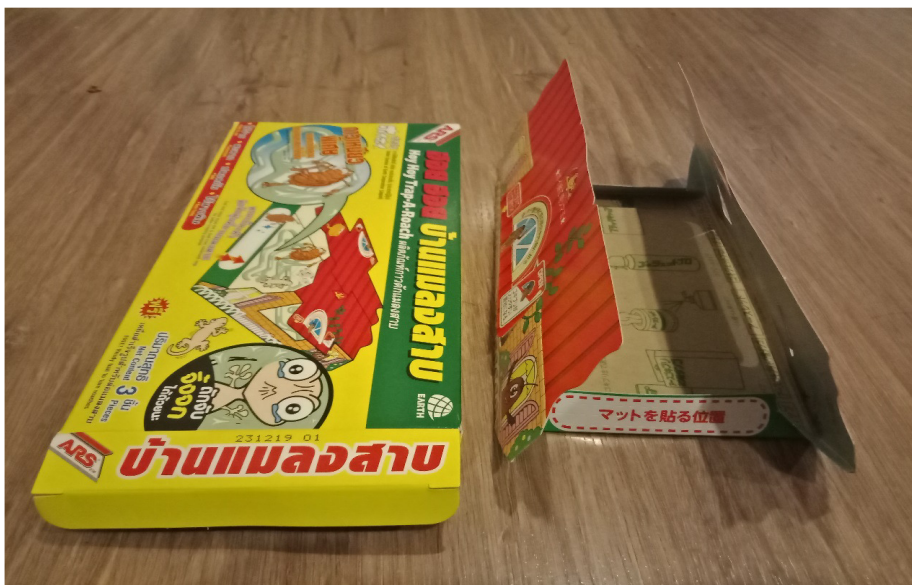
ภาพที่ 3 บ้านดักแมลงสาบ (Roach House)