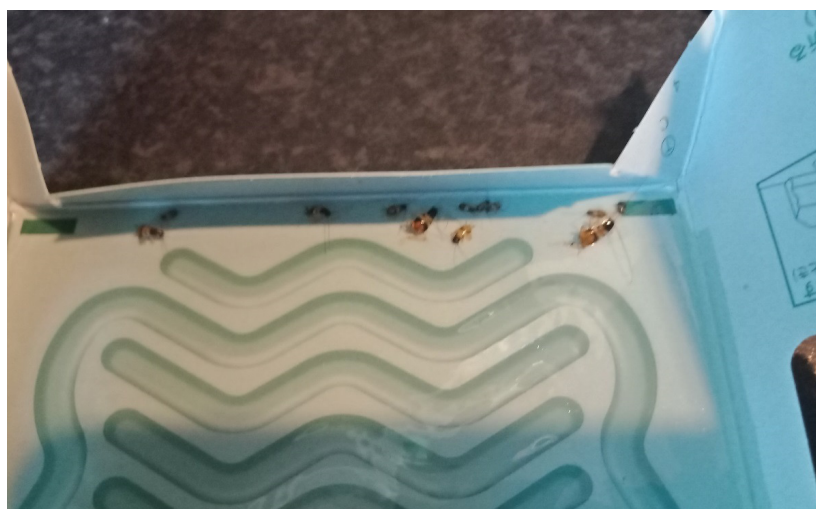
ภาพที่ 4 แสดงแมลงที่ติดกับดักบ้านดักแมลงสาบ (Roach House)