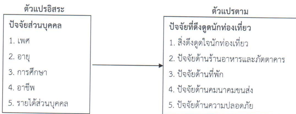
ภาพที่ 1 กรอบแนวคิดในการวิจัย